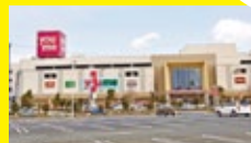
ゆめタウン光の森(4.4km)

医療機関 菊陽台病院……………2.1km 熊本セントラル病院……………2.6km 役場 菊陽町役場……………1.5km