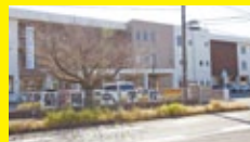
菊陽中学校 徒歩20分(1.6km)