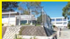
菊陽北小学校 徒歩17分(1.3km)